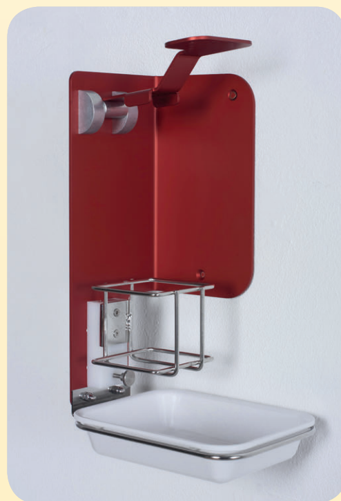
Abb. rechts SPENDER DESIKUS SR mit seitlichem Bedienhebel, platzsparend, maximale Tiefe nur 14,5 cm.

Unser DESIKUS Variosystem, geeignet für alle handelsüblichen Desinfektionsflaschen, bietet eine Lösung zu diesem Problem.