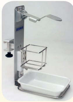
Für Normschiene Best. Nr. 52312