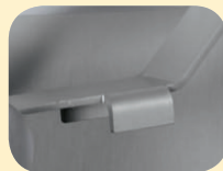
Verdrehschutz für Dispenser

DESINFEKTIONSMITTEL-SPENDER DESIKUS SL , Standardausführung in Eloxal silbergrau und verstellbarem Aufnahmekorb aus V2A elektropoliert, geeignet für