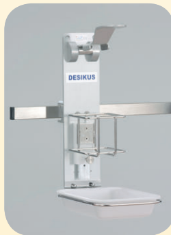
Abb. Links Desikus Modell UTE ST oder N Sekundenschnell an Stativ oder Norm- schiene montiert.

Abb. unten. Abtropfschale m. Bügel Best. Nr. 54415 Abtropfschale einzeln Best. Nr. 54412 Bügel einzeln Best. Nr. 54413