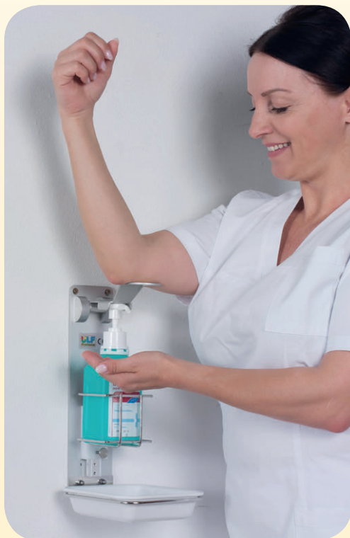
Abb. oben. DESIKUS Modell UTE mit Fronthebelbedienung

Verwendbar für alle gängigen Desinfektionsmittel- u. Seifenflaschen 500 – 1000 ml