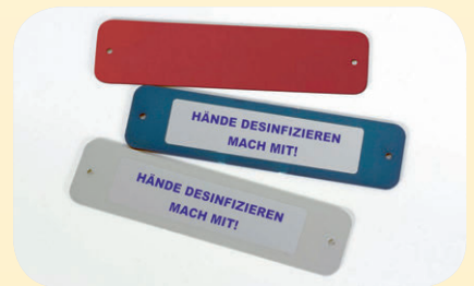
Abb. oben links: Wandtafel Modell SIGNAL aus Aluminium ohne Desinfektionsspender, ohne Abtropfschale und Bügel, für vorhandene Spender, Standardausführung in Eloxal silbergrau, Maße: B 25 cm, T 30 cm, Stärke 4 mm. Best. Nr. 54350

Optional gegen Aufpreis lieferbar in Eloxal rot oder blau Best. Nr. 52328 Abtropfschale mit Bügel Best. Nr. 54415