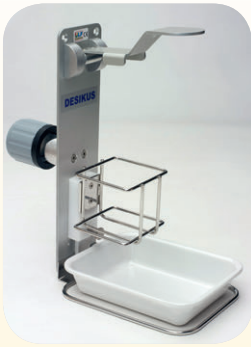
Für Stative Best. Nr. 52311